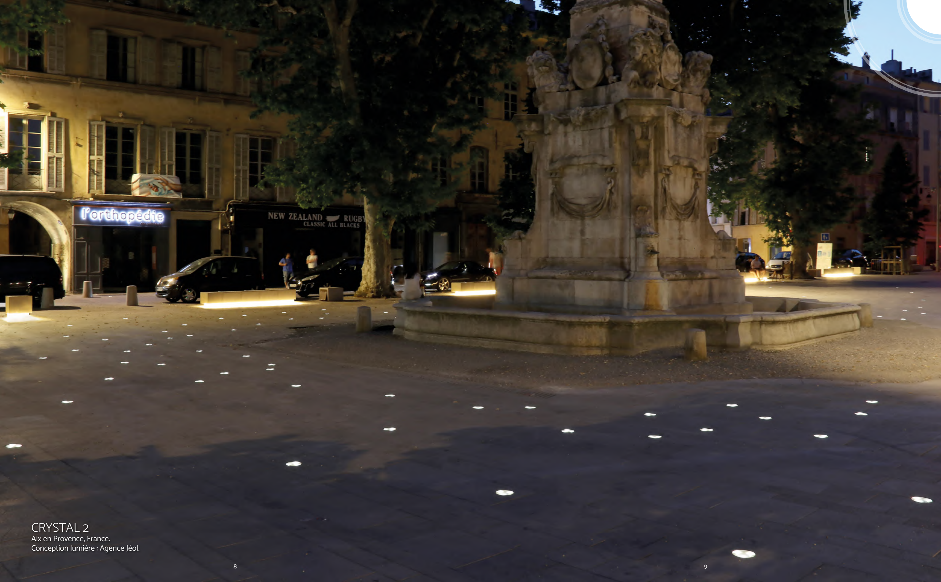
CRYSTAL 2 Aix en Provence, France. Conception lumière : Agence Jéol.