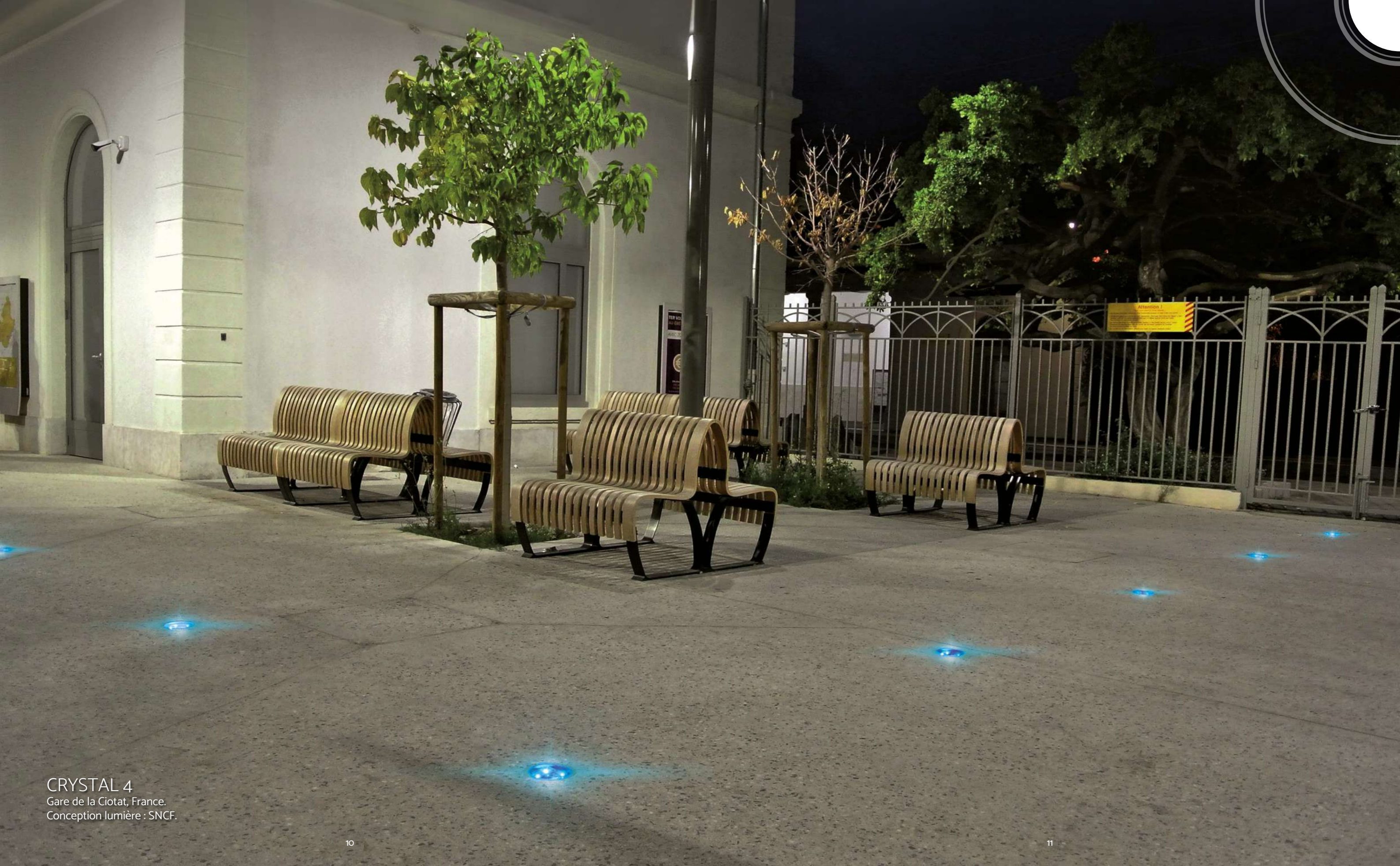
CRYSTAL 4 Gare de la Ciotat, France. Conception lumière : SNCF.