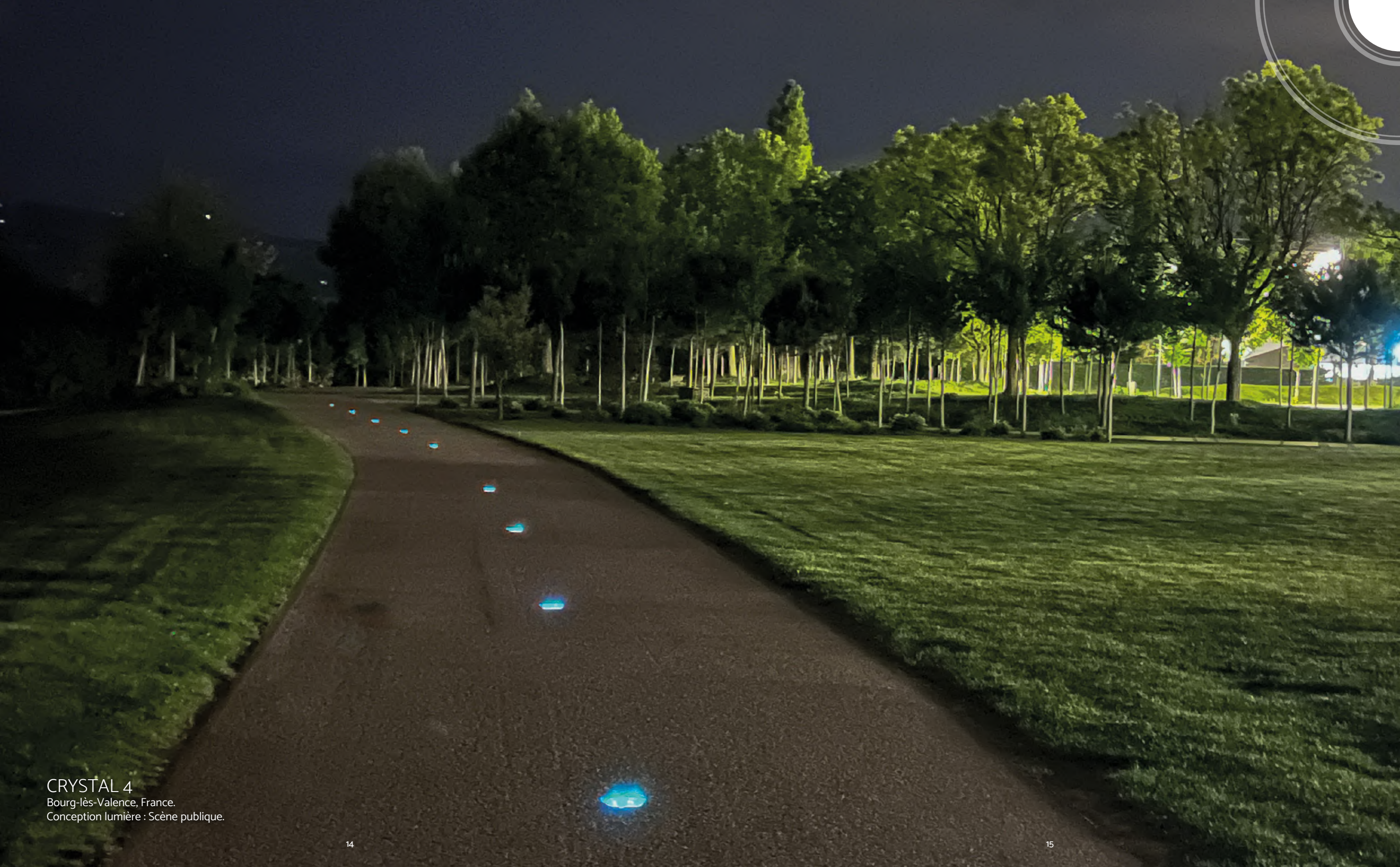
CRYSTAL 4 Bourg-lès-Valence, France. Conception lumière : Scène publique.