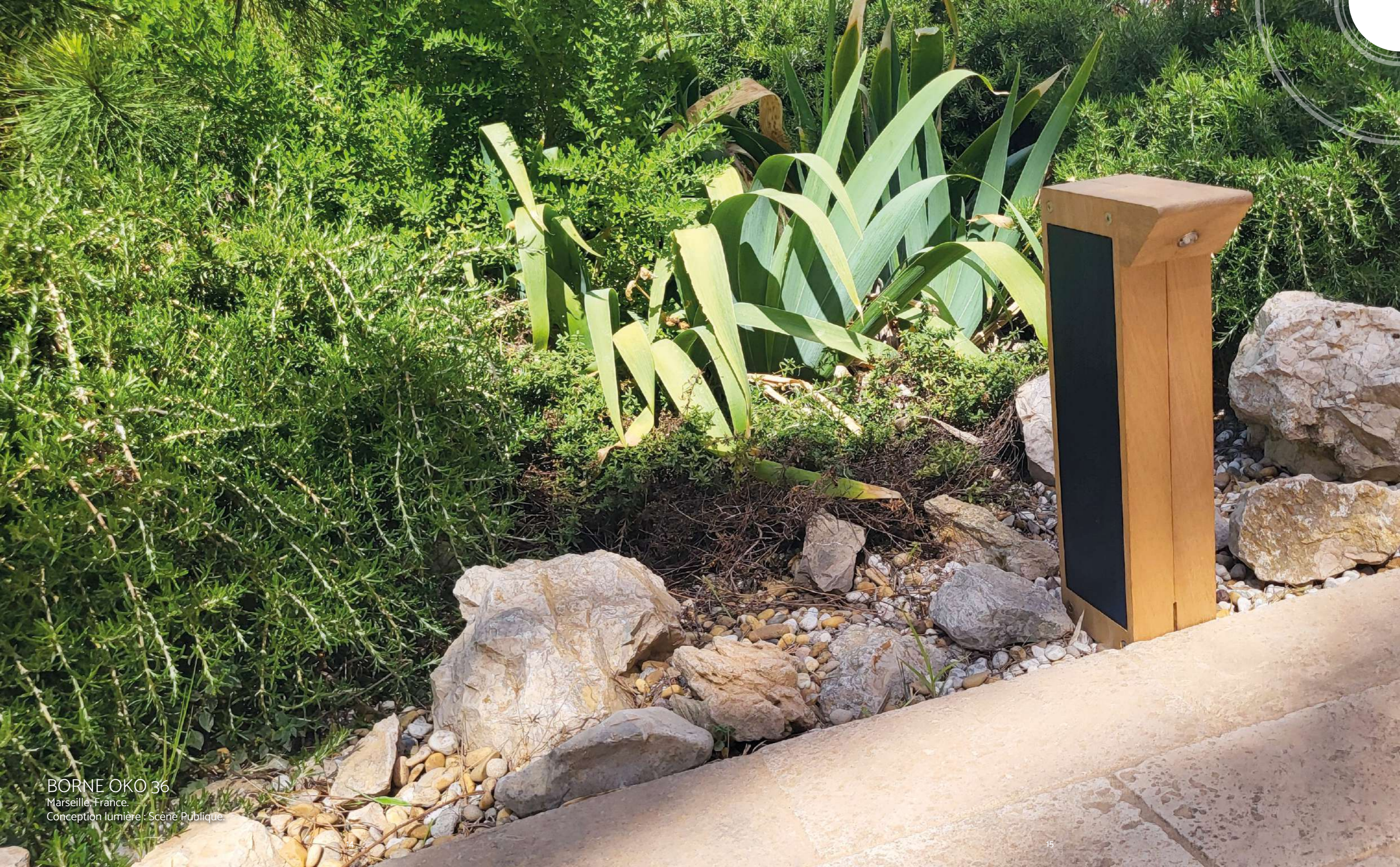
BORNE OKO 36 Marseille, France. Conception lumière: Scène Publique.