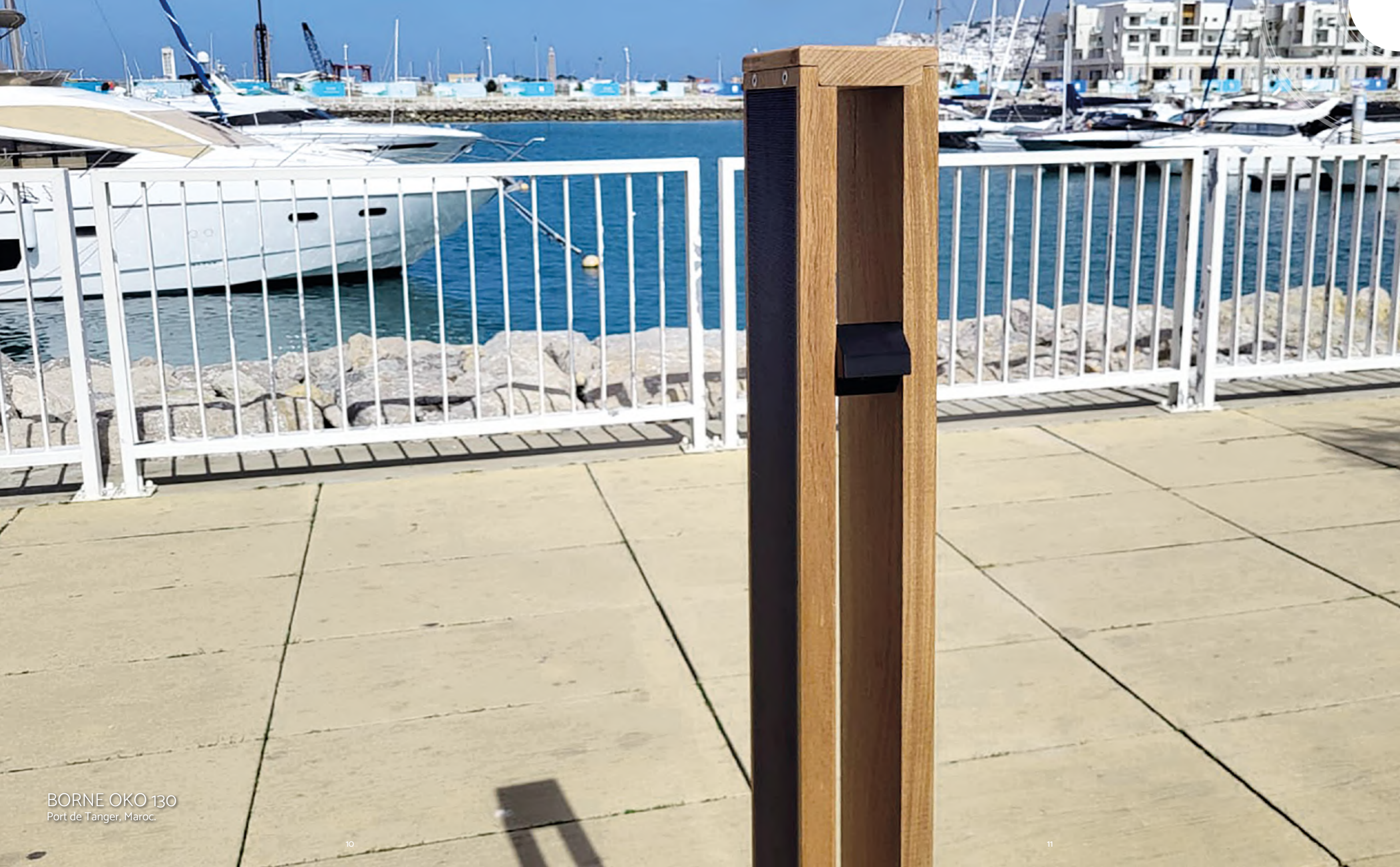
BORNE OKO 130 Port de Tanger, Maroc.