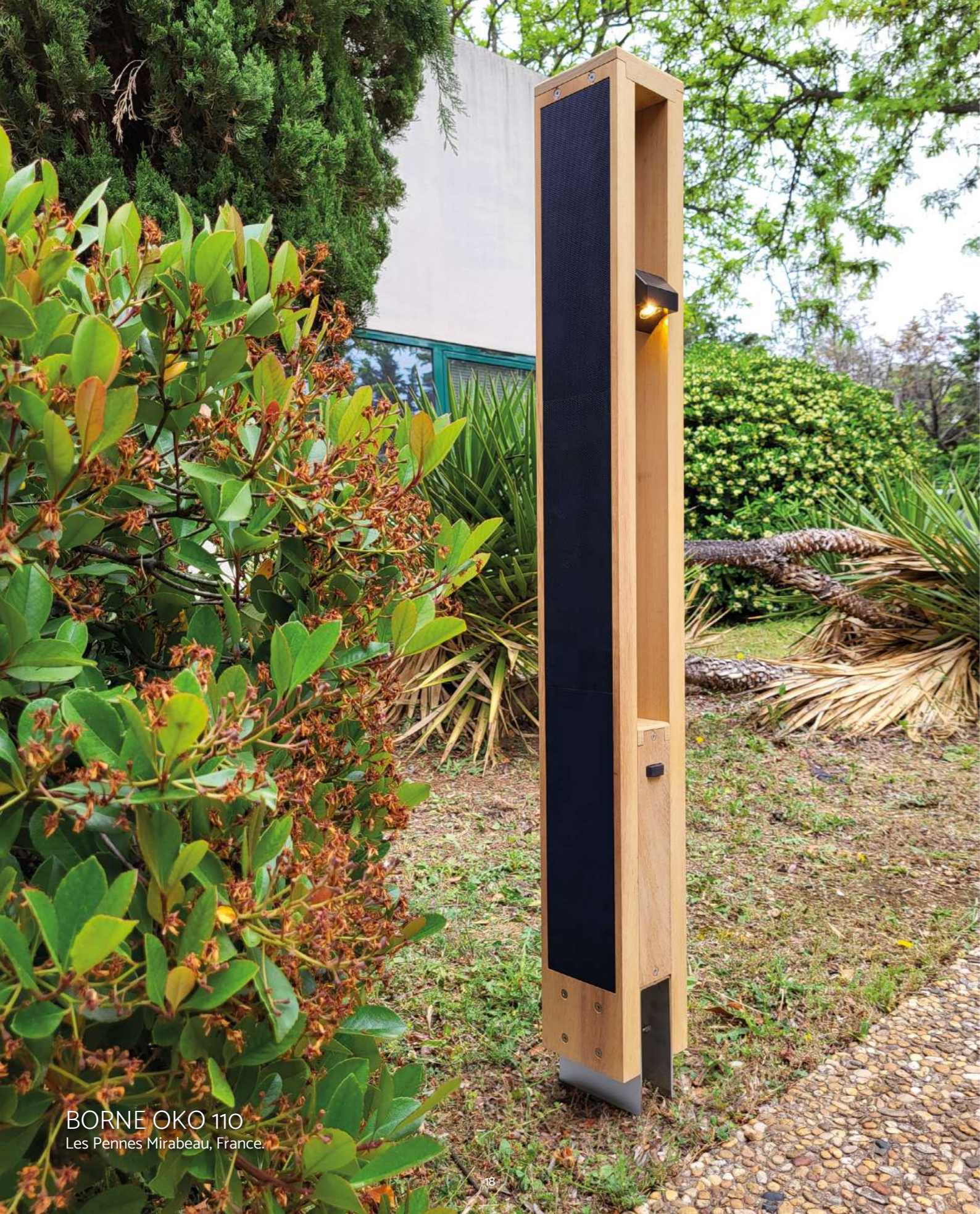
BORNE OKO 110 Les Pennes Mirabeau, France.