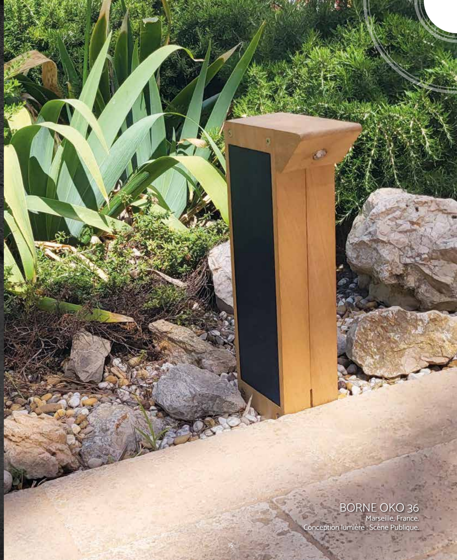
BORNE OKO 36 Marseille, France. Conception lumière : Scène Publique.