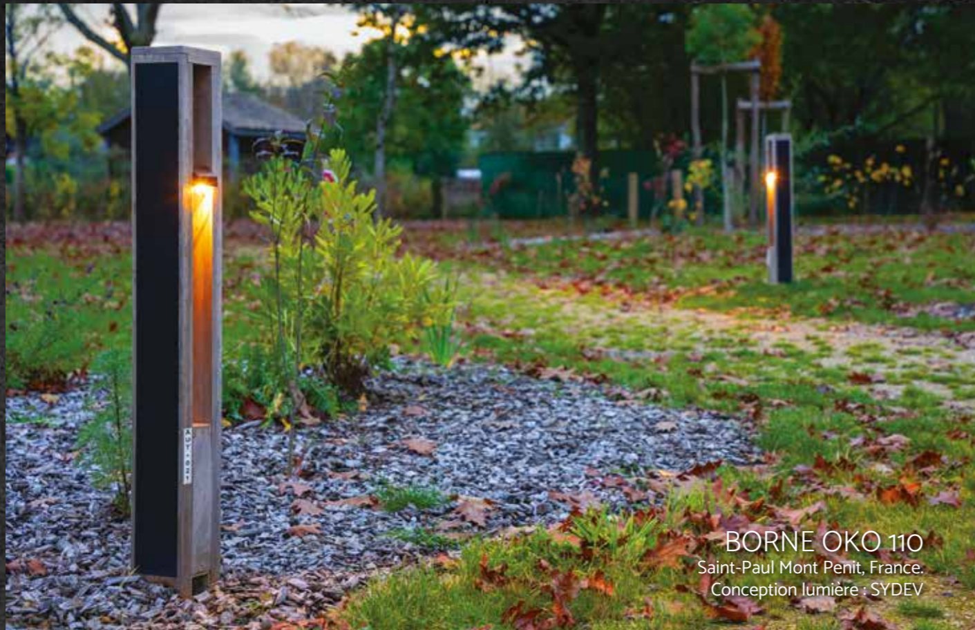
BORNE OKO 110 Saint-Paul Mont Penit, France. Conception lumière : SYDEV