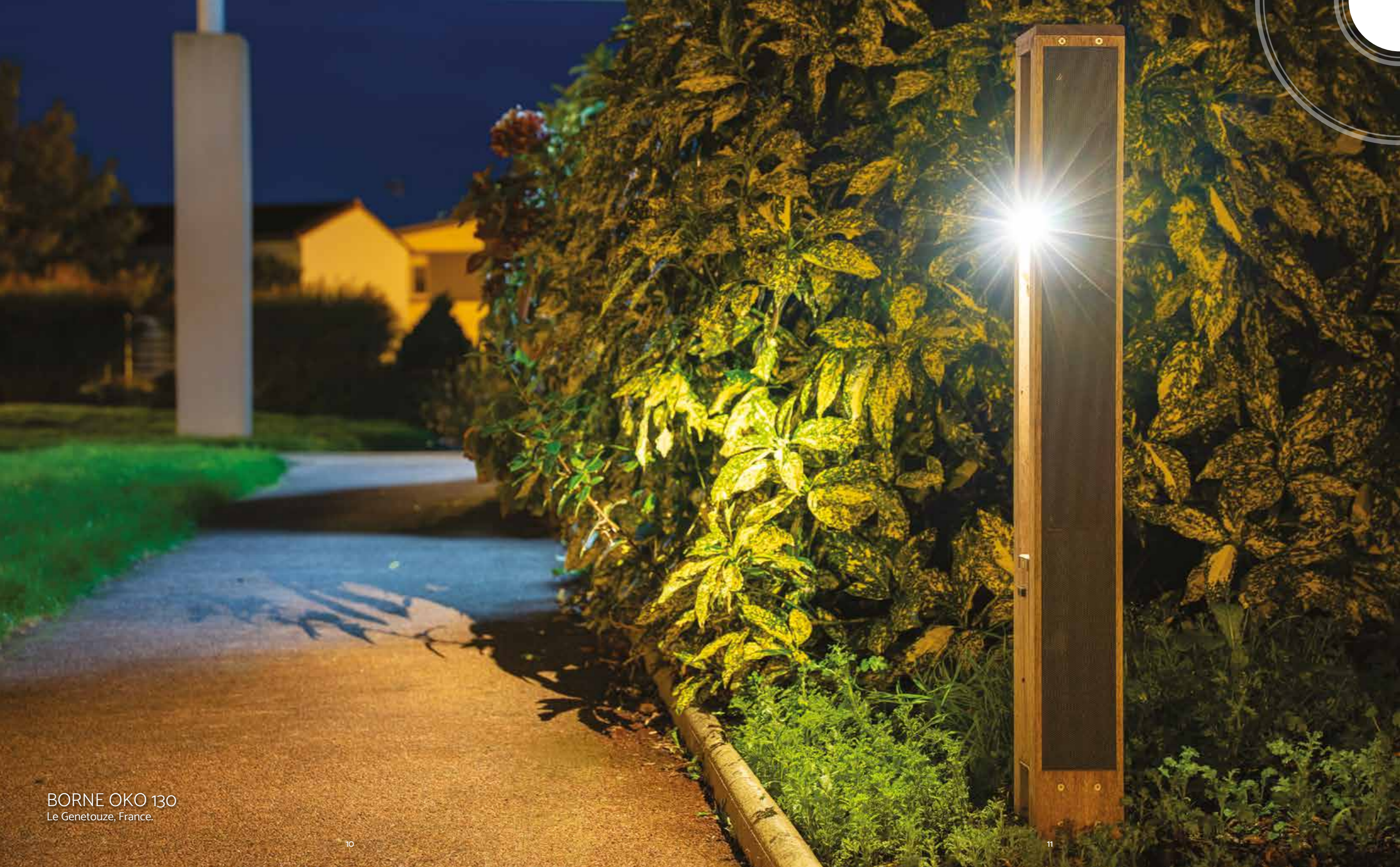
BORNE OKO 130 Le Genetouze, France.