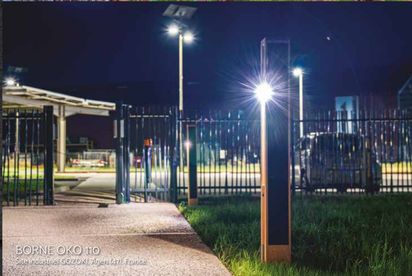
BORNE OKO 110 Site industriel GOZOKI, Agen (47), France.